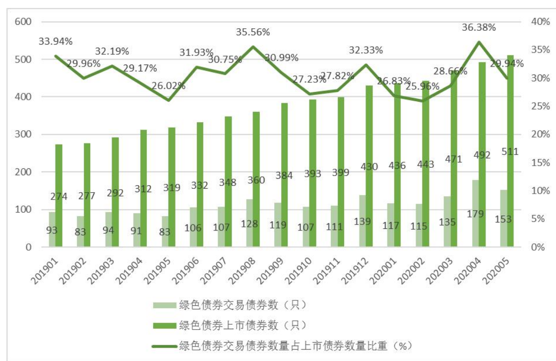
图 3：按月度绿色债券二级市场交易数量及占比统计