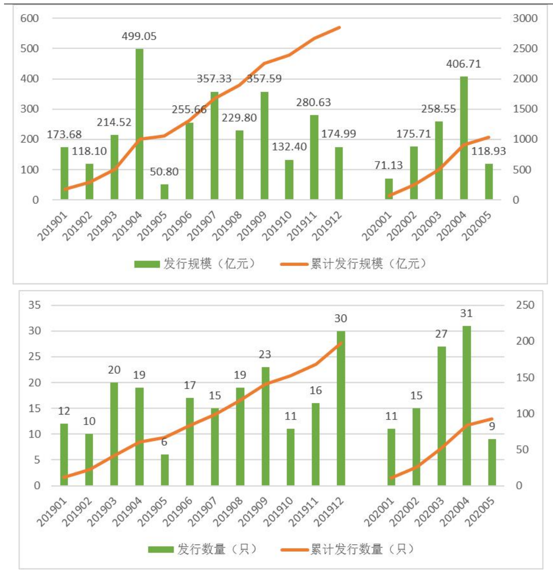
图 1: 2019.01-2020.04 绿色债券发行规模 (上) 和发行数量 (下)